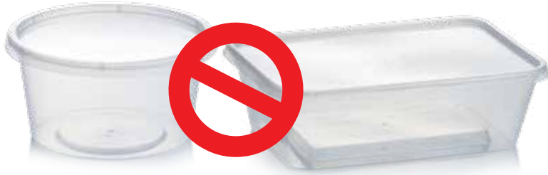
عبوات الطعام البلاستيكية التي تستخدم لمرة واحدة