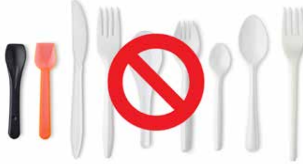
أدوات المائدة البلاستيكية التي تستخدم لمرة واحدة