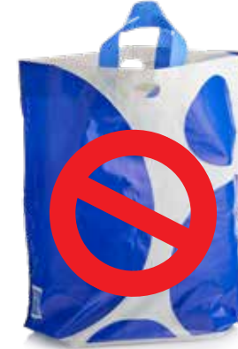
الأكياس البلاستيكية السميكة