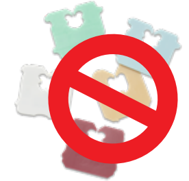
رقعات تغليف الخبز البلاستيكية

للمزيد من المعلومات، قم بزيارة replacethewaste.sa.gov.au