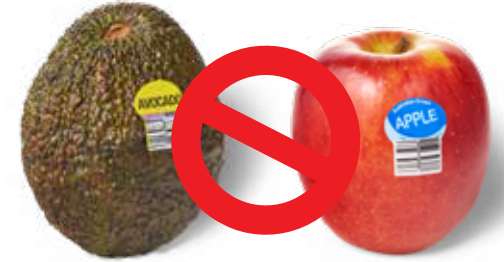
ملصقات الفاكهة البلاستيكية