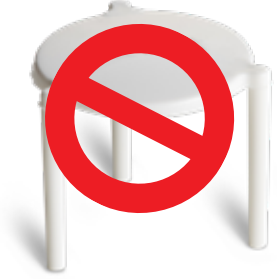
حافظات البيتزا البلاستيكية