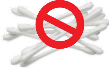
الأعواد القطنية المصنوعة من البلاستيك