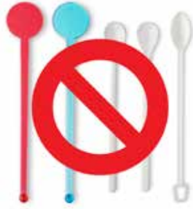
ملاعق التحريك البلاستيكية التي تستخدم لمرة واحدة