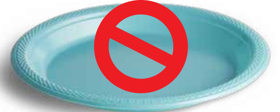
الأطباق البلاستيكية التي تستخدم لمرة واحدة