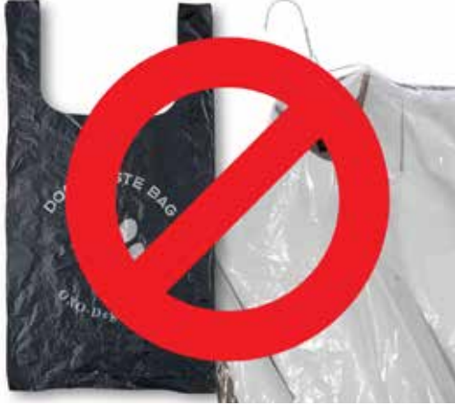
المنتجات البلاستيكية القابلة للتحلل بالأكسجين