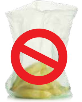
الأكياس البلاستيكية الخفيفة