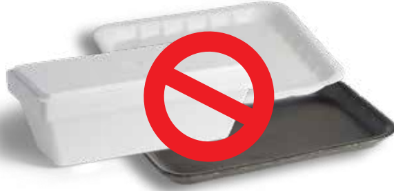
حاويات الطعام/المشروبات EPS الأخرى