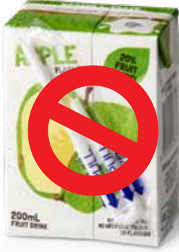
المنتجات المعبأة مسبقاً بمرفقات بلاستيكية