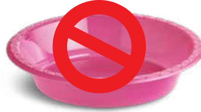
الأوعية البلاستيكية التي تستخدم لمرة واحدة