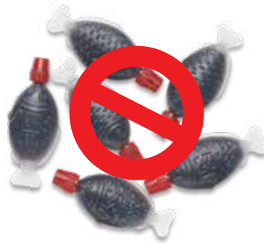
عبوات صوص الصويا البلاستيكية