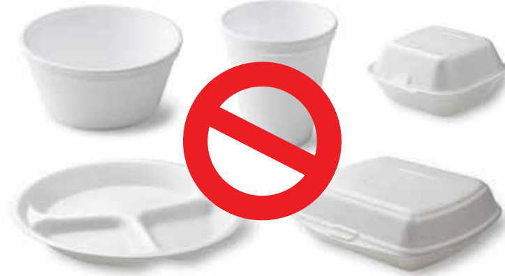
الأكواب والأوعية والأطباق وحاويات المحار المصنوعة من البوليسترين المُشكل