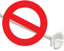
أعواد/أربطة البالون البلاستيكية