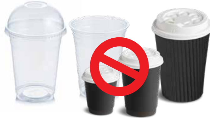
العبوات والأغطية وسدادات المشروبات البلاستيكية التي تستخدم لمرة واحدة (بما في ذلك فناجين القهوة)