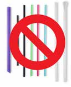
المصاصات البلاستيكية التي تستخدم لمرة واحدة