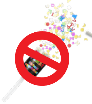
القصاصات المنثورة البلاستيكية