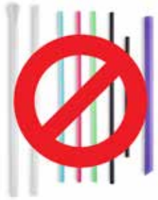
Ống hút nhựa dùng một lần