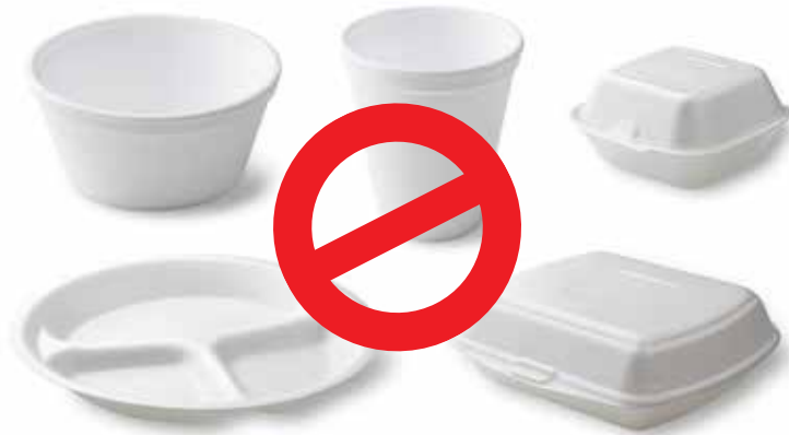
Cốc ly, tô chén, đĩa và hộp đựng kiểu vỏ sò bằng nhựa xốp