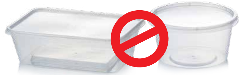
Hộp đựng thực phẩm bằng nhựa dùng một lần

MUỐN BIẾT THÊM THÔNG TIN, HÃY TRUY CẬP replacethewaste.sa.gov.au