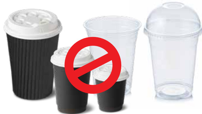
Đồ đựng thức uống bằng nhựa dùng một lần, Nắp đậy và Đồ cắm chặn thức uống đổ tràn (bao gồm ly cà phê)