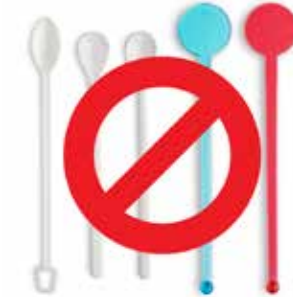
Que khuấy nhựa dùng một lần