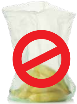
Túi bao Ny-lông đựng Sản phẩm