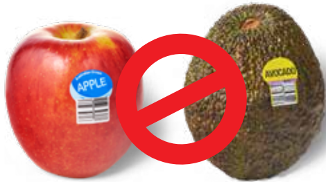
Nhãn nhựa dán trái cây