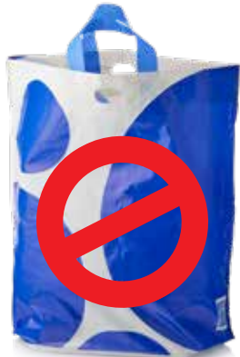
Túi bao Ny-lông dày hơn