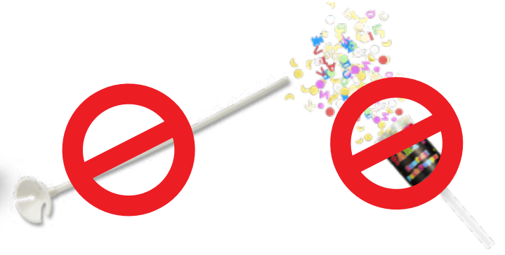
Dây buộc/Que cầm Bong bóng bằng nhựa