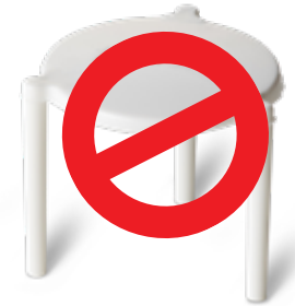
Đế nhựa đặt trên pizza để chống chịu nắp hộp (Plastic Pizza Savers)