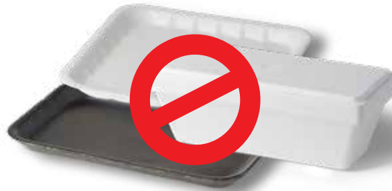
Hộp đựng Thực phẩm/Thức uống khác bằng nhựa xốp