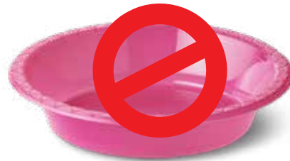
Tô chén nhựa dùng một lần