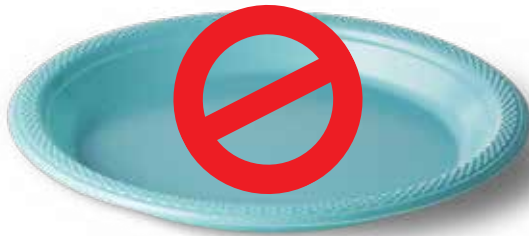
Đĩa nhựa dùng một lần