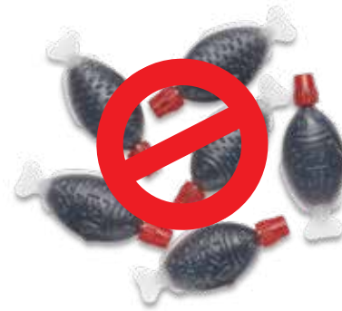
Con Cá Nhựa Đựng Nước tương