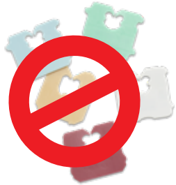
Miếng Nhựa Cột Bao Bánh mì