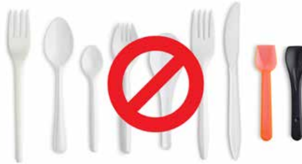
Dao muỗng nĩa nhựa dùng một lần