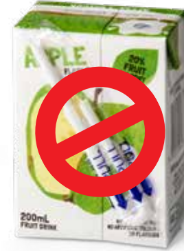
Sản phẩm đóng gói sẵn có ống hút nhựa đính kèm