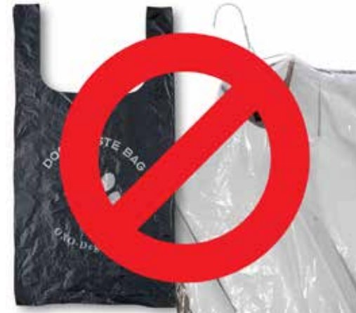
Sản phẩm nhựa tự phân hủy oxo