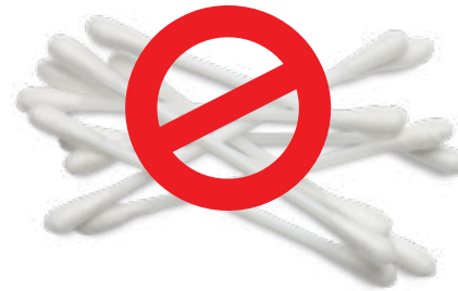
Tăm bông que nhựa